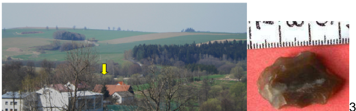
Kněžice - "V ďamách"