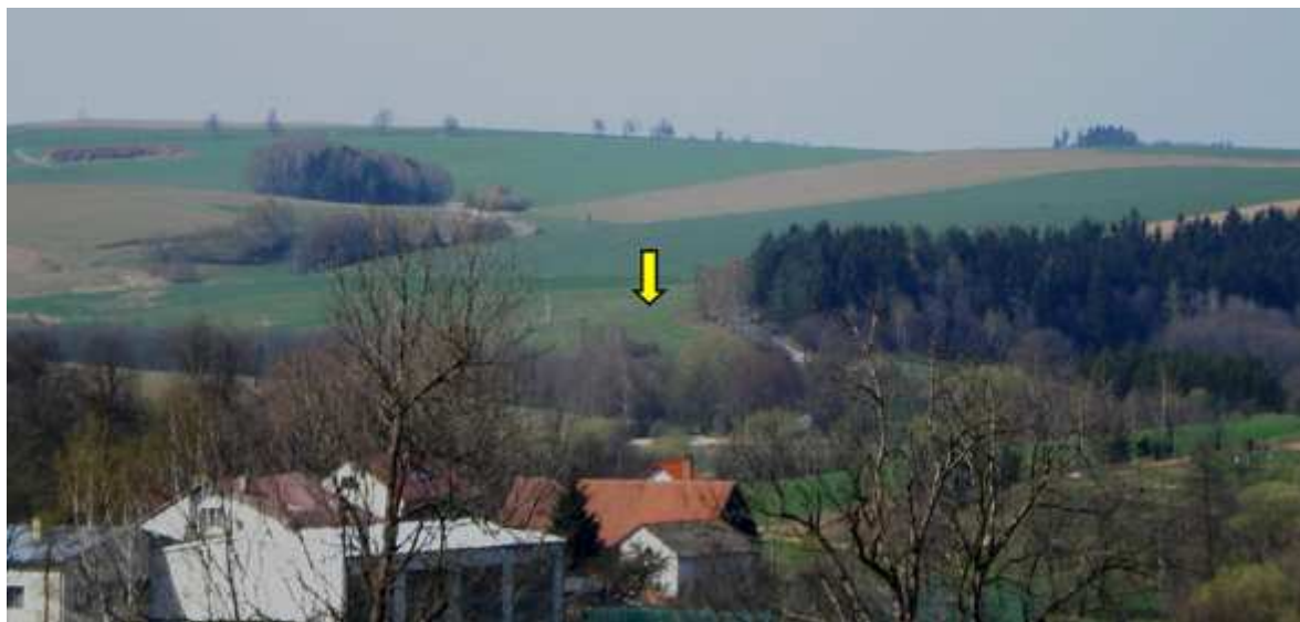
ČÍHADLA 1, POHLED NA CENTRUM LOKALITY OD JIHU (FOCENO OD VĚTROVA)