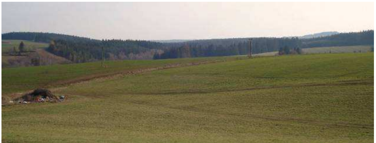
Pohled na centrum archeologické lokality Kněžice - Brodce od SZ