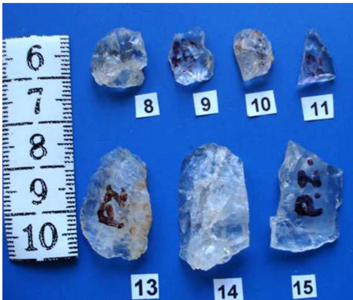
Foto č. 21. Výběr kamenné štípané industrie