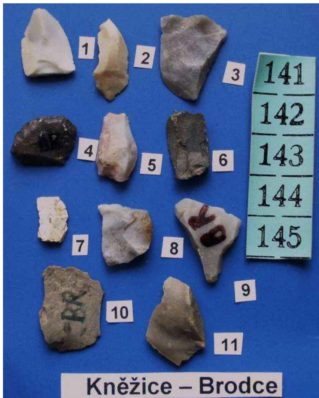
Foto č. 12. Výběr kamenné štipané industrie