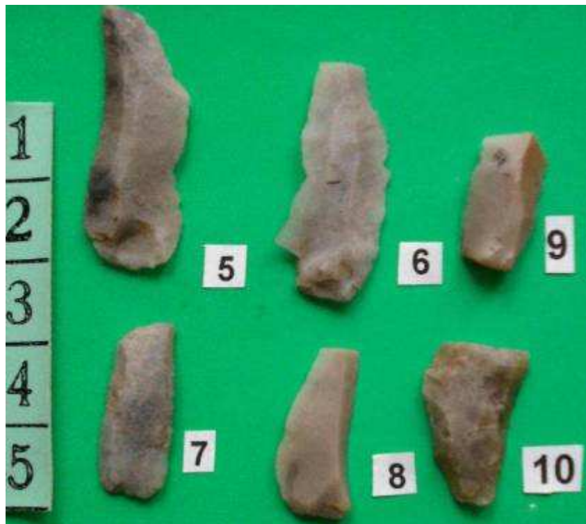
Foto č. 4. Výběr kamenné štipané industrie