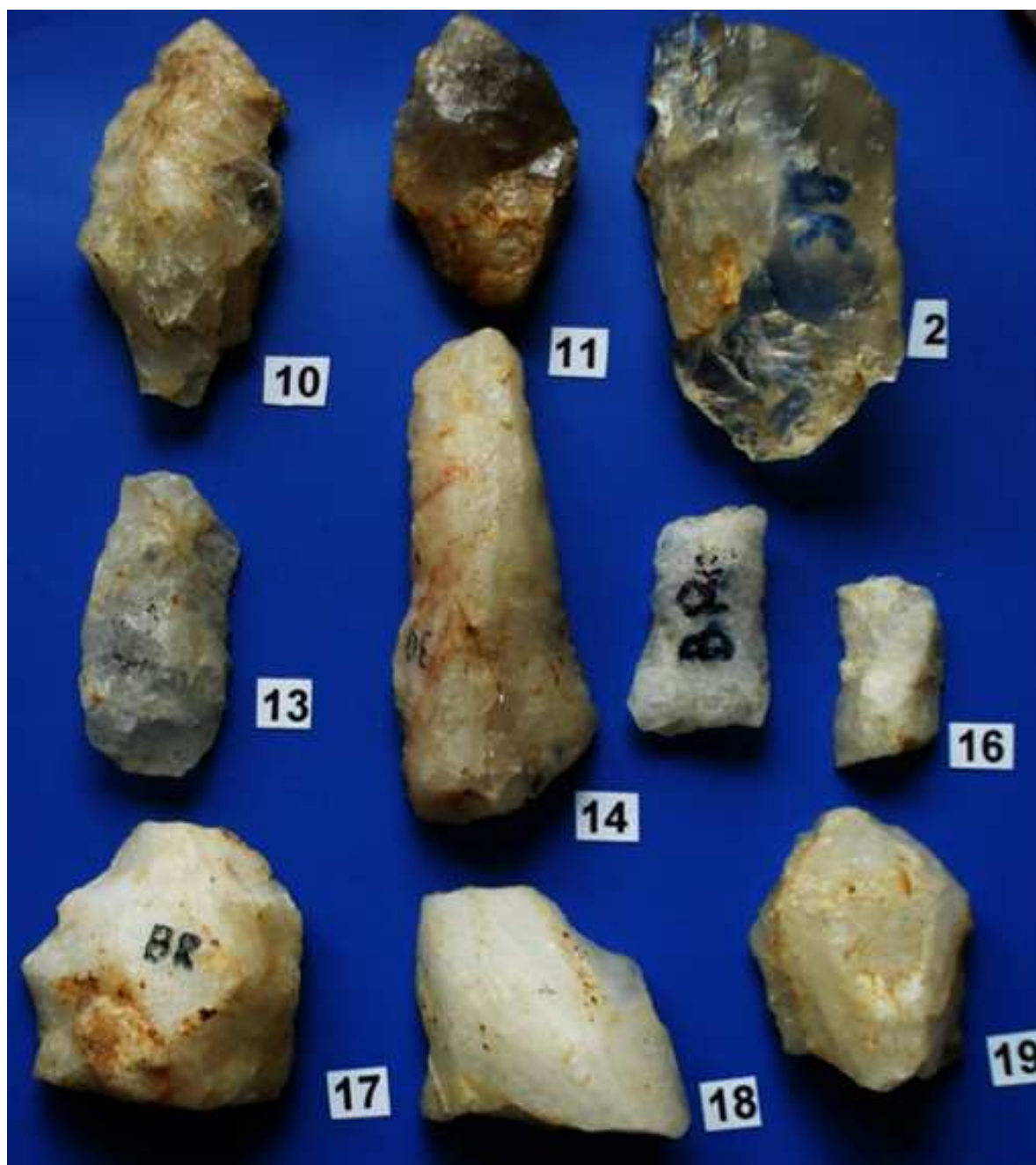
Foto č. 11. Výběr kamenné štipané industrie