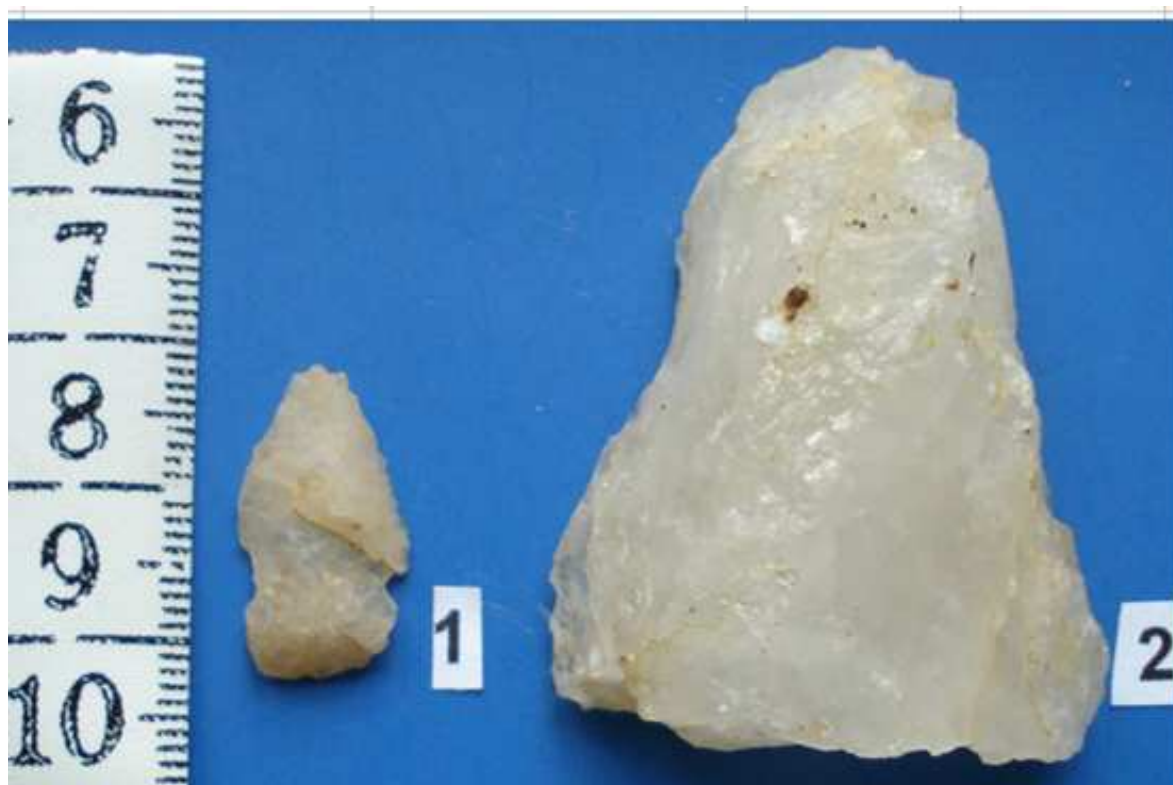
Foto č. 24. Výběr kamenné štípané industrie