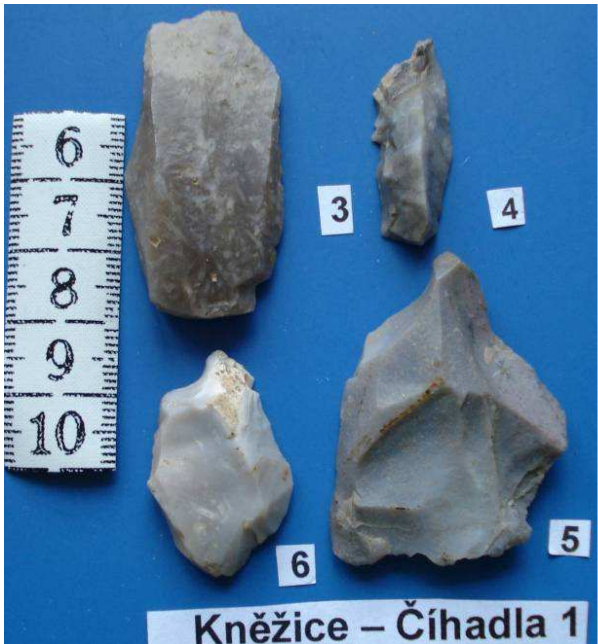
Foto č. 25. Výběr kamenné štipané industrie