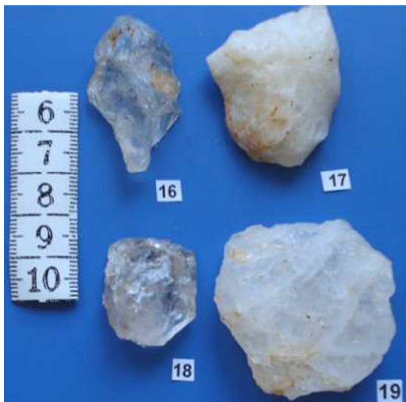
Foto č. 19. Výběr kamenné štipané industrie