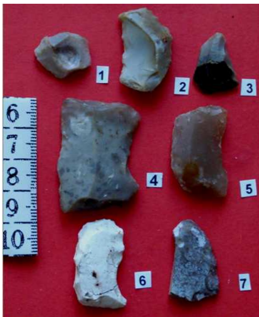
Foto č. 20. Výběr kamenné štipané industrie