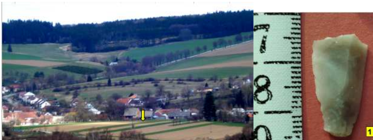
KNĚŽICE – CAHOVO POLE