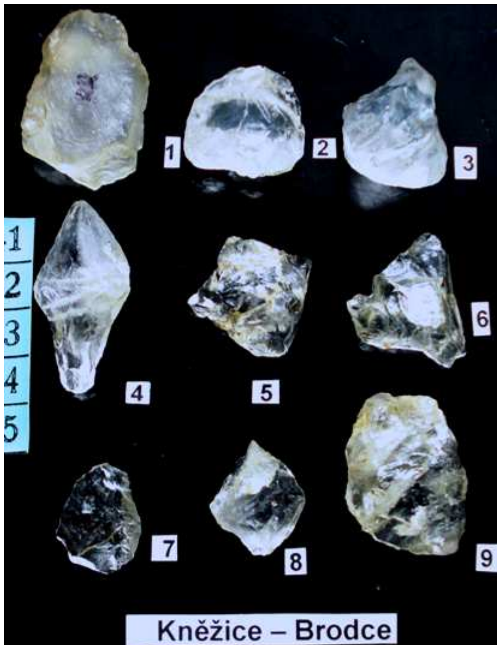
Foto č. 10. Výběr kamenné štípané industrie