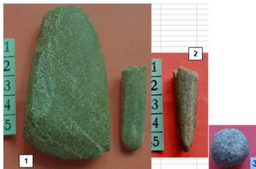
Foto č. 17. Broušená kamenná industrie