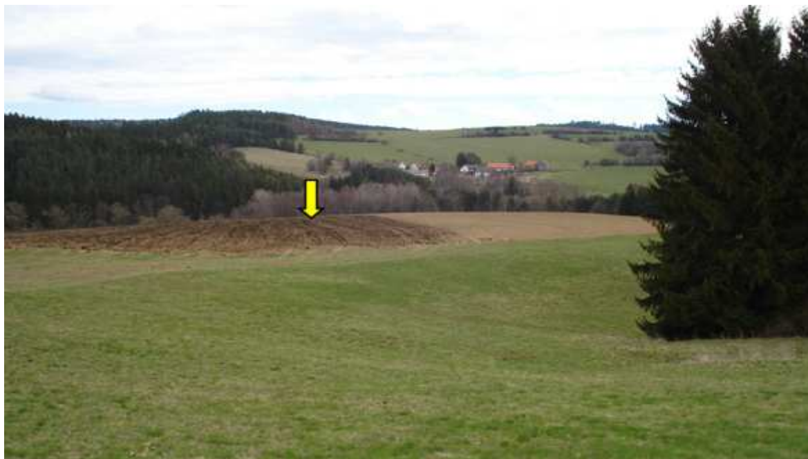
POHLED NA LOKALITU ČÍHADLA 2 OD SILNICE BŘTNICE - KNĚŽICE, V POZADÍ JE VIDĚT RYCHLOV