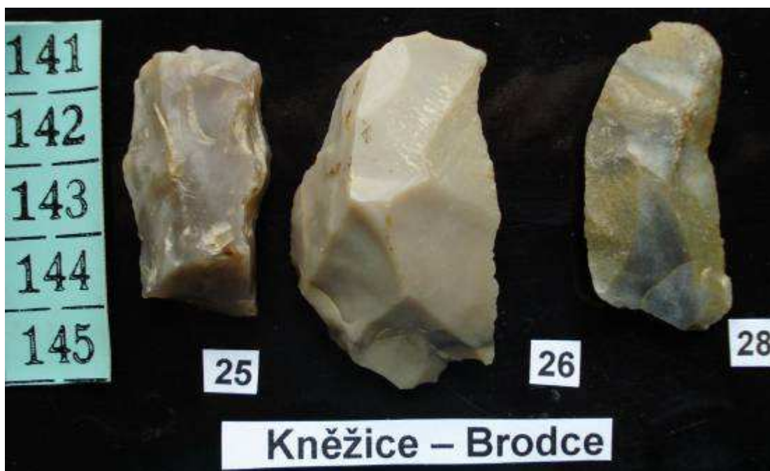
oto č. 13. Výběr kamenné štípané industrie