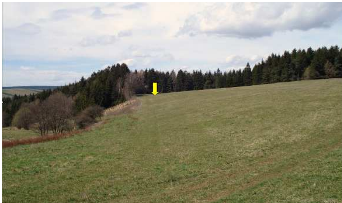
Lokalita Rychlov, v pozadí a před okrajem lesa ( šipka)