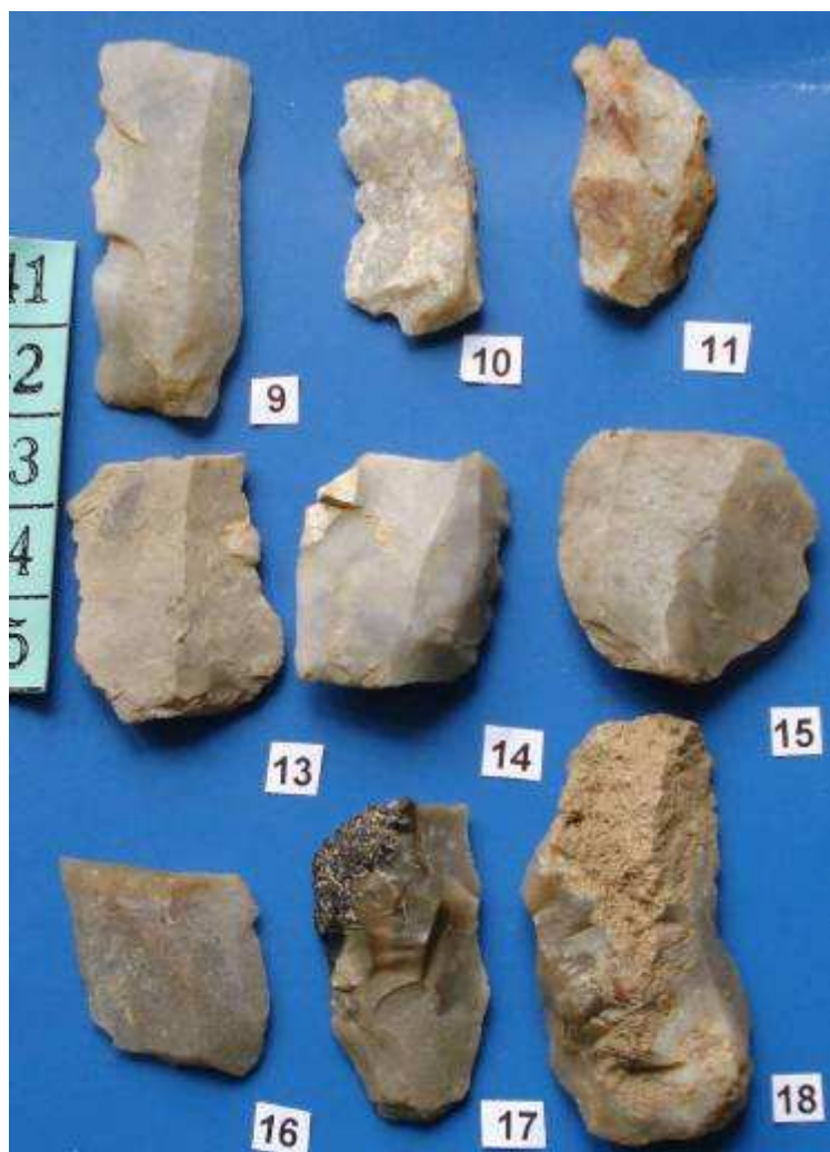
Foto č. 7. Výběr kamenné štípané industrie, viz. následná tabulka