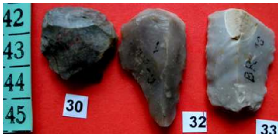
Foto č. 13. Výběr kamenné štípané industrie