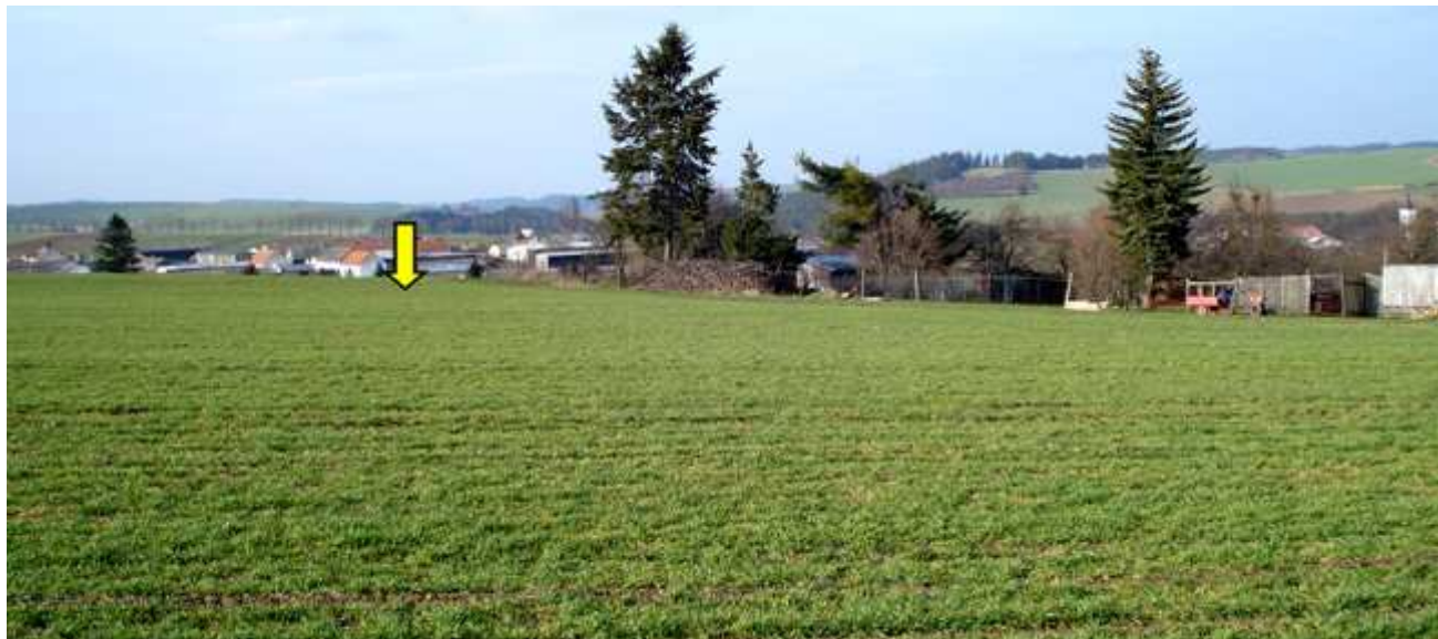
POHLED NA CENTRUM LOKALITY OD JIHU