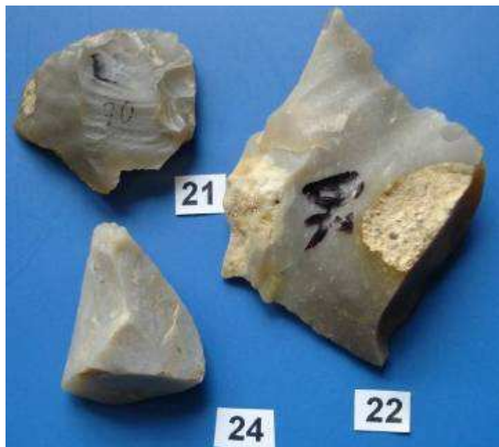
Foto č. 16. Výběr kamenné štípané industrie