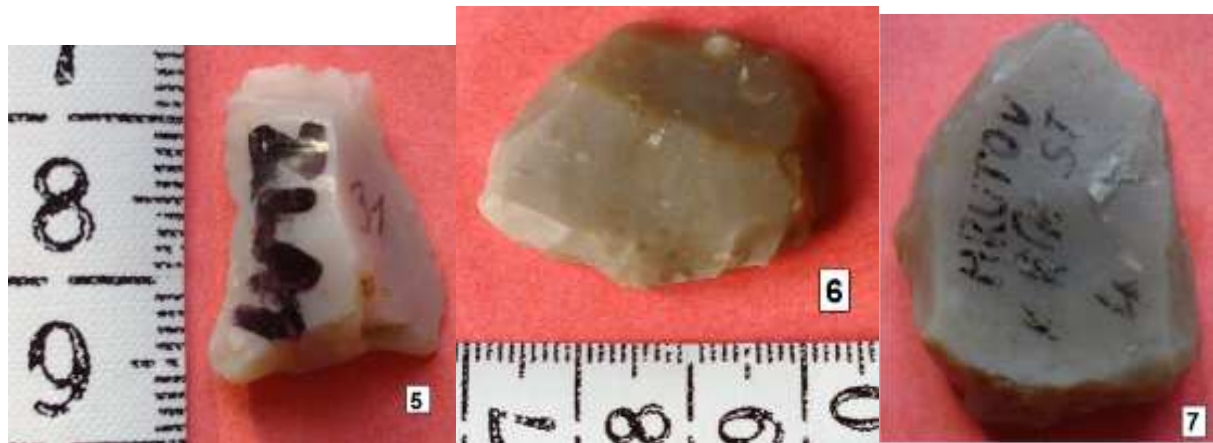
Foto č. 30. Výběr kamenné štipané industrie