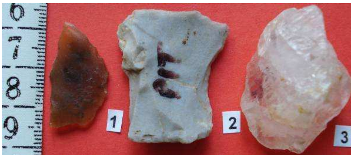
Foto č. 22. Výběr kamenné štípané industrie