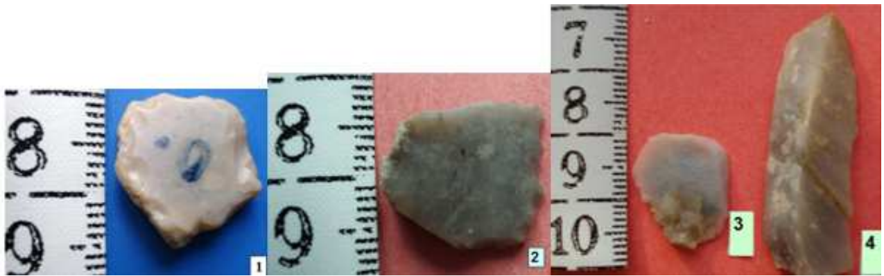
Foto č. 29. Výběr kamenné štipané industrie