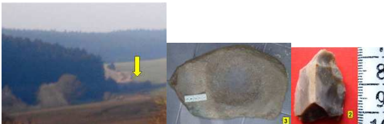
KNĚŽICE - LUŽ E