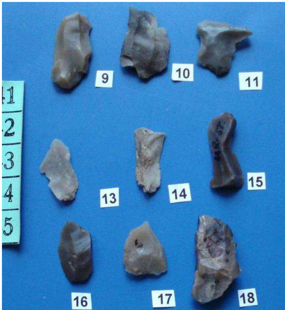
Foto č. 8. Výběr kamenné štípané industrie, viz. následná tabulka