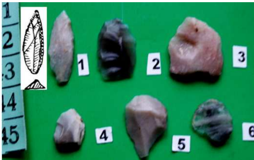
Foto č. 1. Výběr kamenné štípané industrie, viz. následná tabulka