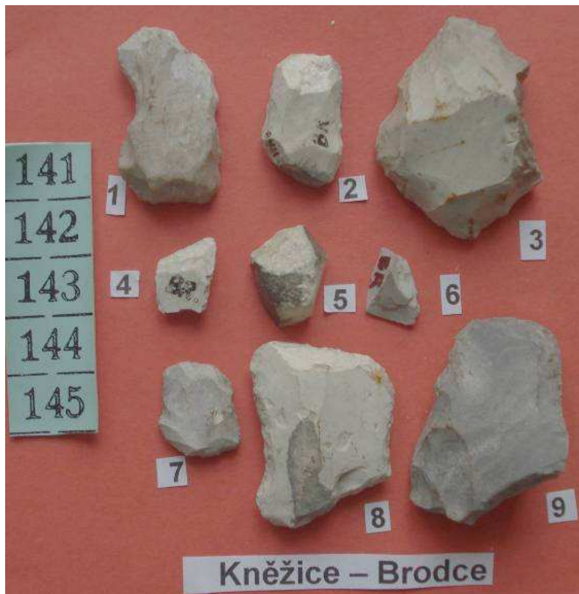
Foto č. 15. Výběr kamenné štipané industrie