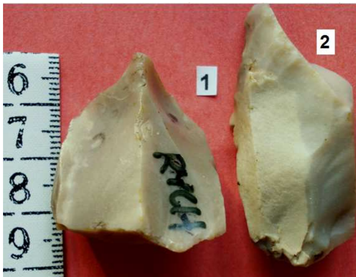
Foto č. 23. Výběr kamenné štípané industrie