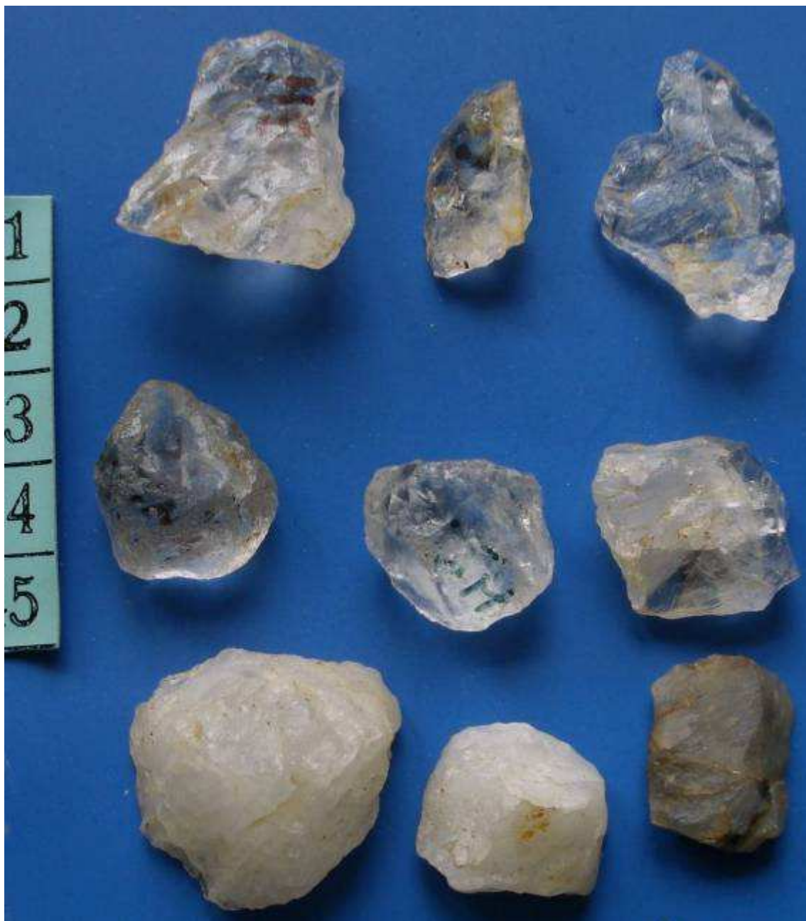
Foto č. 9. Výběr kamenné štípané industrie 44 - 52 KŘIŠŤÁLOVÁ A KŘEMENNÁ INDUSTRIE