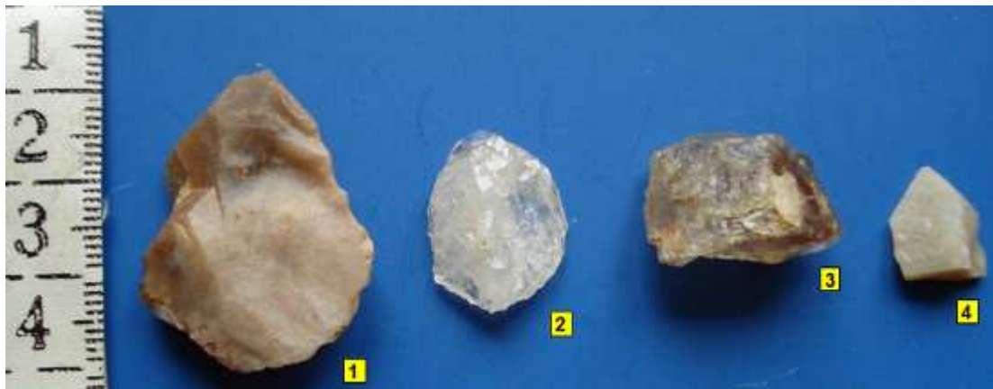
Foto č. 26. Výběr kamenné štipané industrie