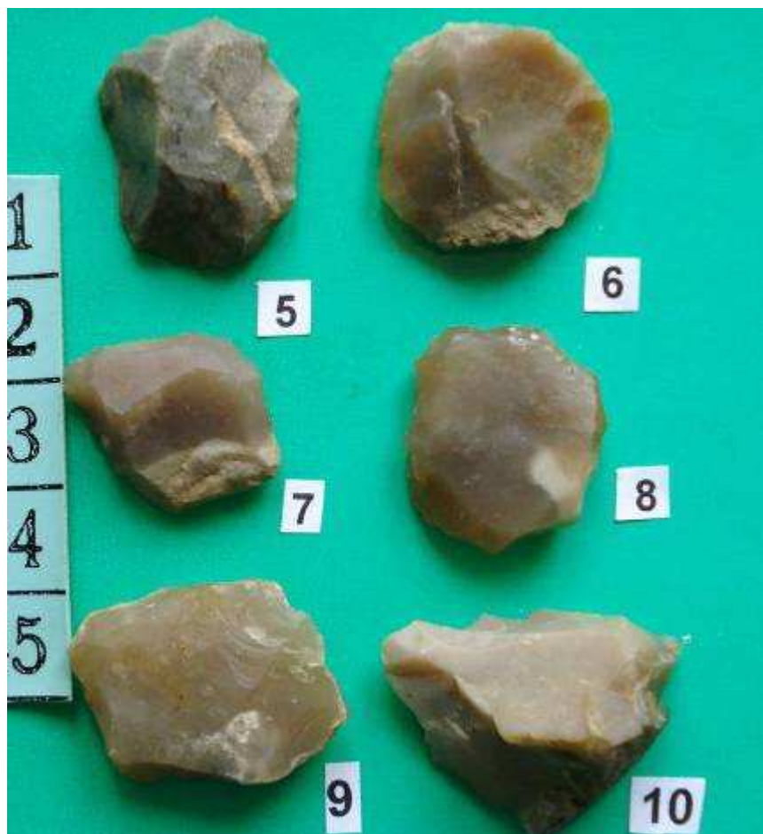
Foto č. 2. Výběr kamenné štipané industrie, viz. následná tabulka