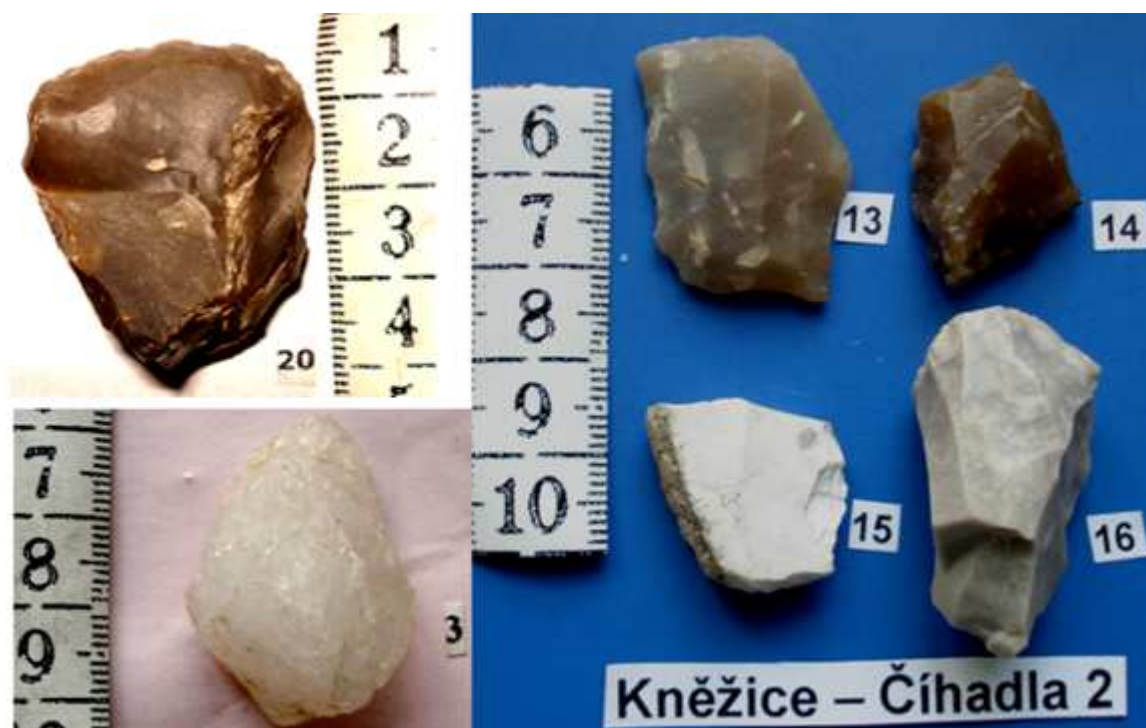
Foto č. 28. Výběr kamenné štipané industrie