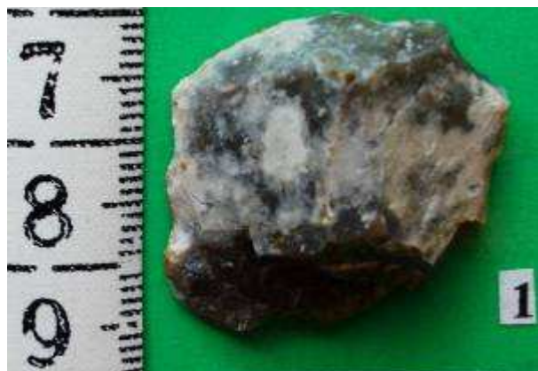
Foto č. 14. Výběr kamenné štipané industrie