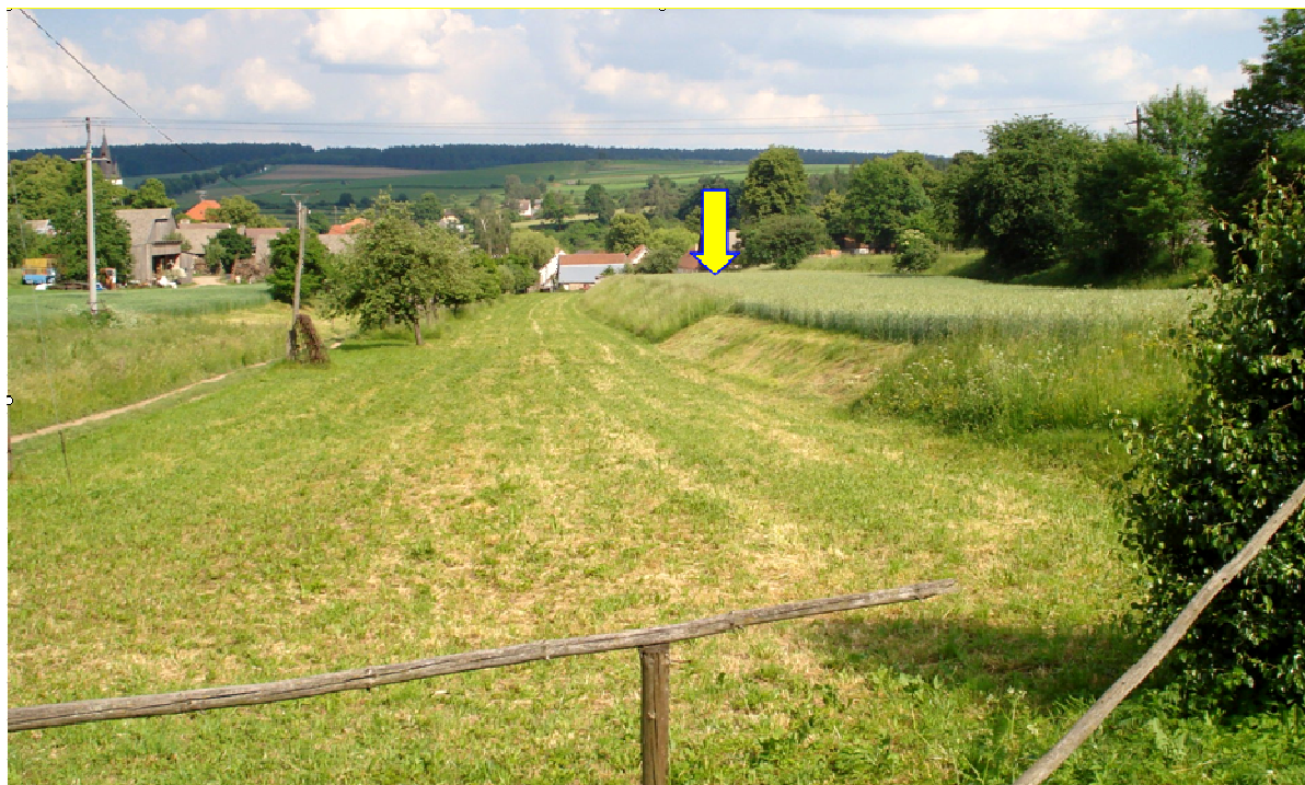
LOKALITA KNĚŽICE - ZA OBCHODEM JE POD ŠIPKOU NA KONCI OBLNÉHO POLE