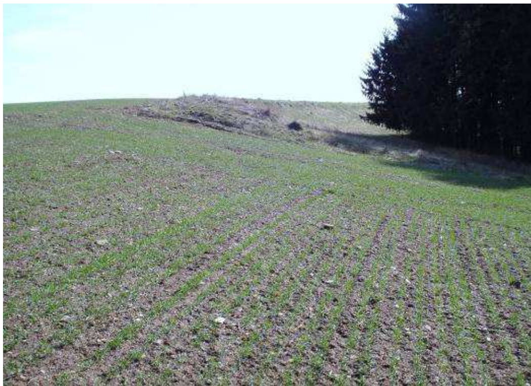
Pohled na centrum archeologické lokality Hrutovská stráň od jihu