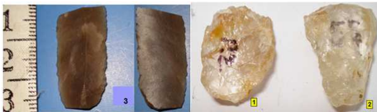
Foto č. 18. Výběr kamenné štipané industrie