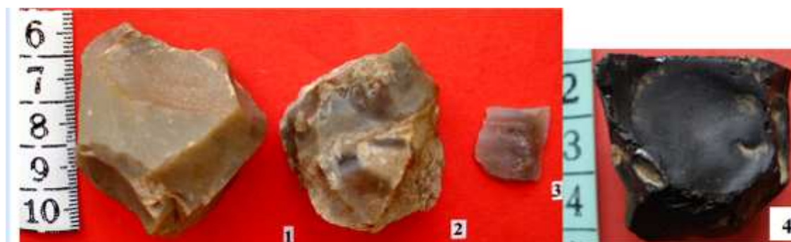
Foto č. 3. Výběr kamenné štipané industrie, viz. následná tabulka