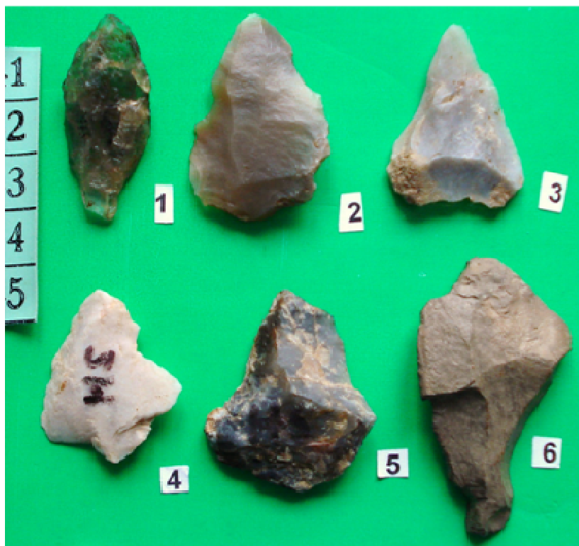
Foto č. 5. Výběr kamenné štípané industrie