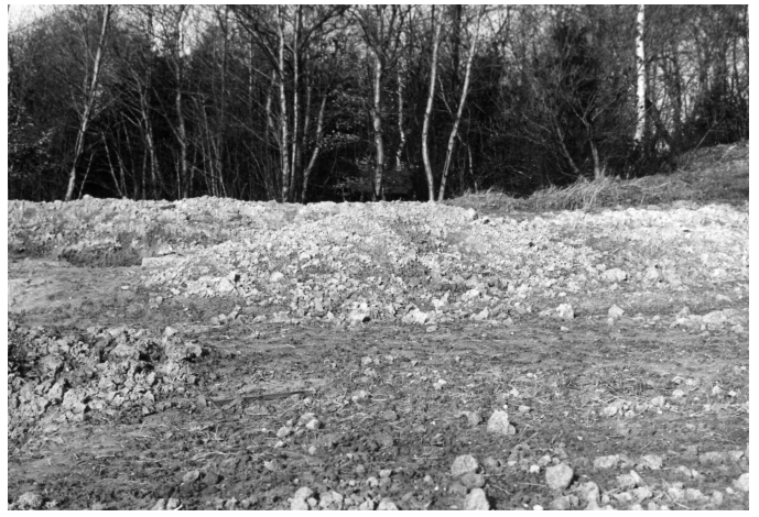
Archeologický výzkum v roce 1976 na lokalitě Hájov 1.