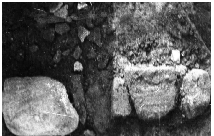
Zachované části zídky pravěkého obydlí.