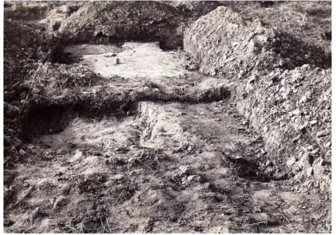
Archeologický výzkum v roce 1976 na lokalitě Hájov 1.