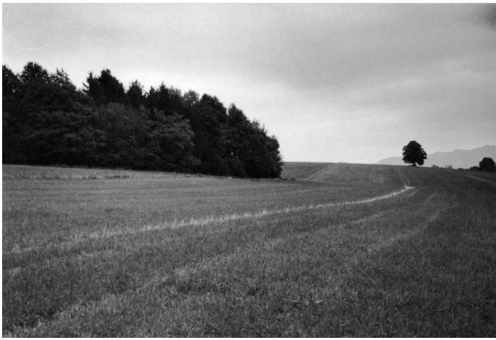
Starší pohled na lokalitu Hájov 1.